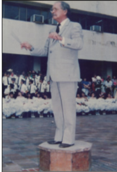
Imagen 4. Plaza de Banderas fiestas de San Pedro.

La Banda Departamental del Huila, de ese momento estaba conformada por 18 o 20 músicos aproximadamente, era una banda pequeña y utilizaban un atuendo militar. Gestionaba, situaciones como la de los instrumentos que estaban en mal estado, pues requerían de mucha inversión para su mantenimiento y reparación al igual que la uniformidad, los salarios y demás estímulos, los cuales fueron su objetivo primordial como director.