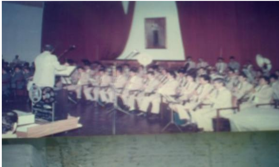
Imagen 13. Banda Sinfónica Asamblea Departamental