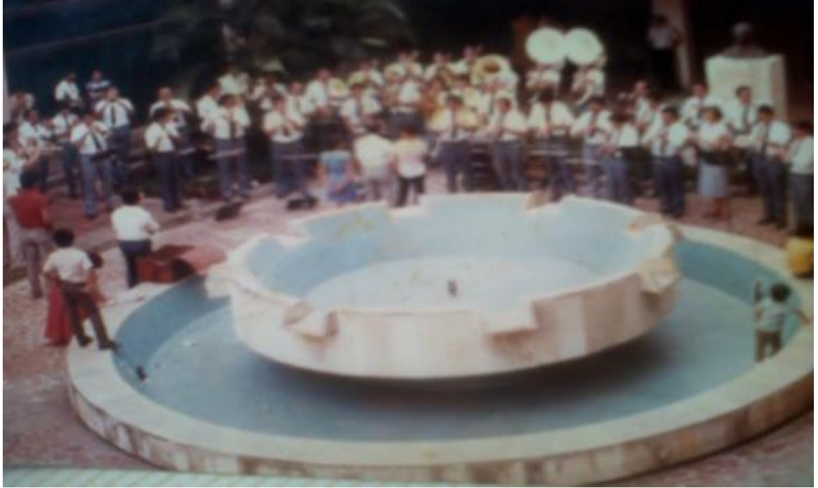
Imagen 15. Plazoleta de la Gobernación