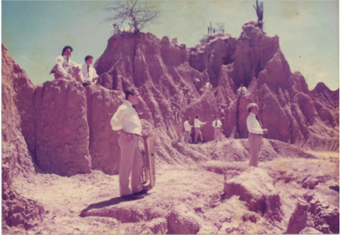
Imagen 17. Desierto de la Tatacoa Villavieja Huila