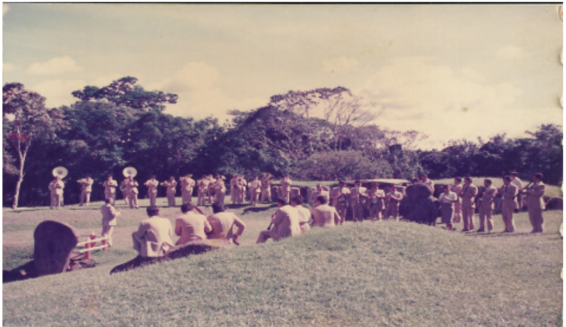
Imagen 16. Parque de San Agustín Huila