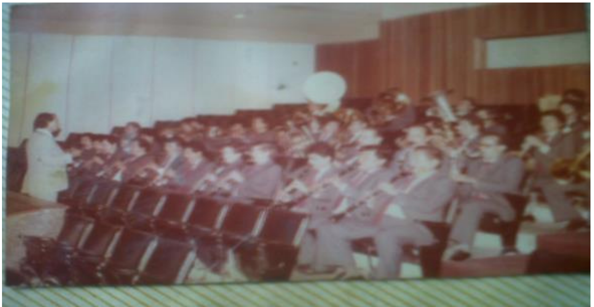
Imagen 14. Gradería Asamblea Departamental