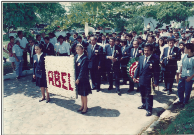
Imagen 11. Cementerio Jardines el Paraíso Neiva, Banda Sinfónica del Huila

La noticia del deceso se conoció en la asamblea departamental del Huila en el marco de la instalación del consejo departamental de cultura; allí, llenos de consternación manifestaron sus condolencias a familiares y allegados del maestro por parte del mismo gobernador de aquel entonces, doctor Julio Enrique Dussán Cuenca, quien manifestó el acompañamiento las exequias por parte suya y de todo el gabinete.