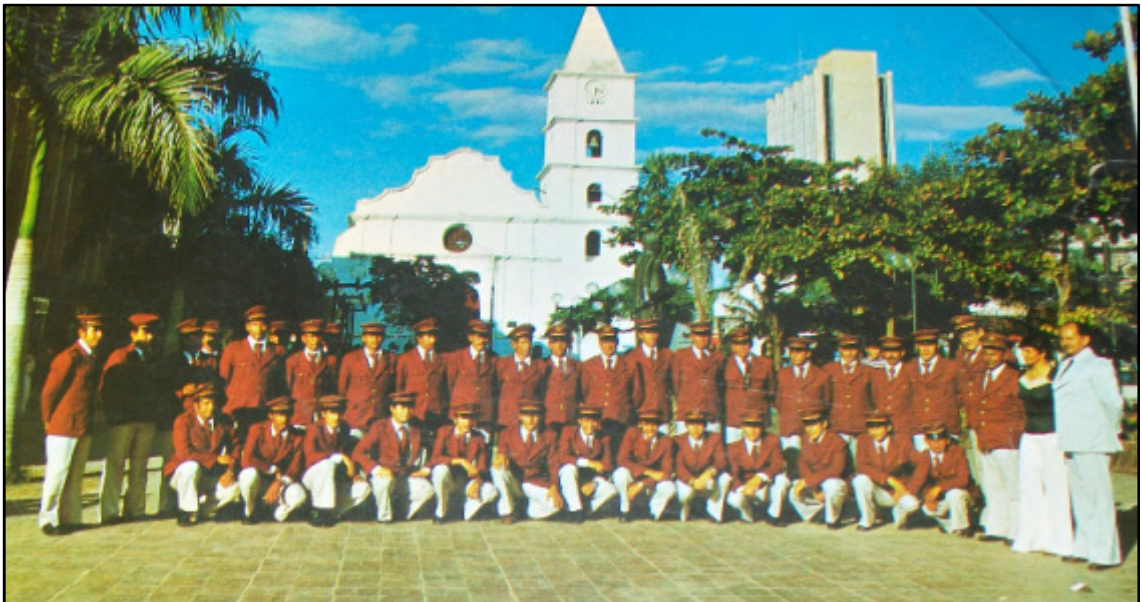
Imagen 5. Banda Sinfónica, Parque Santander, en el fondo Iglesia Colonial.