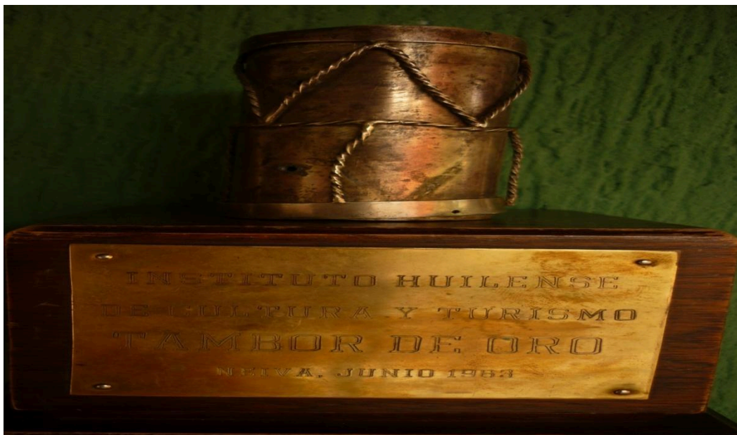
Fig. 9 Tambor de oro