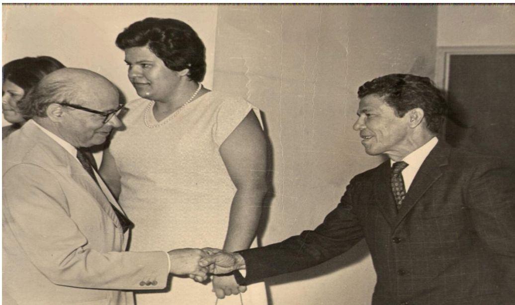
Anexo 6: Reconocimientos