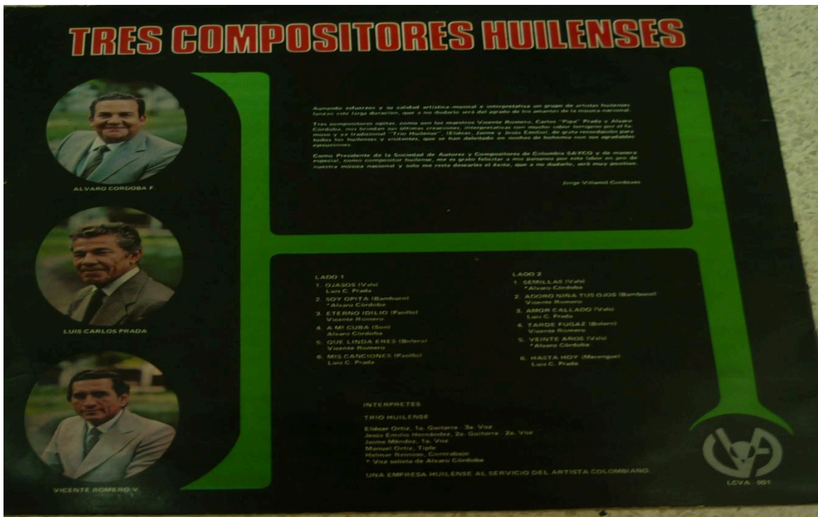
Fig. 7: Carátula del disco del Trío Huilense.

También trabajó en la orquesta de su amigo Alberto Rosero Concha, quien fue el que le enseñó a tocar saxofón; luego trabaja con la orquesta del español Pepe Mena como cantante y saxofonista.