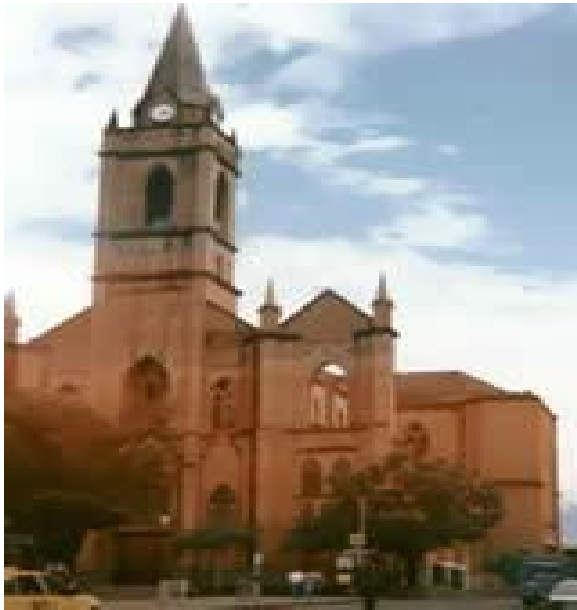
Fig 1. Edificio Nacional y Catedral "Nuestra Señora de la Concepción",

Neiva entró en una etapa de estancamiento y olvido, hasta cuando en 1905 fue constituido el Departamento del Huila y la ciudad retornó a su condición de capital, pero de un ente territorial más pequeño. Otro golpe demoledor para Neiva, al igual que para todo el país fue la Guerra de los Mil Días que trajo ruina y desesperanza