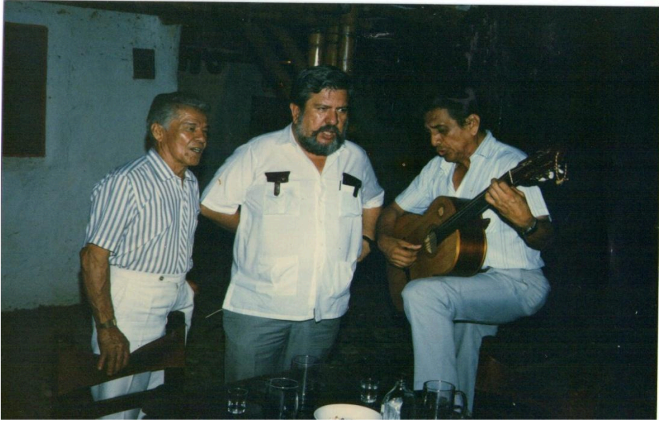
Saludando al presidente Misael Pastrana Borrero