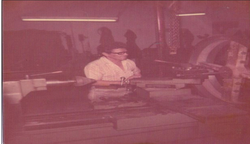
Fig.6: 'Pipa' en su taller

“Lo recuerdo como un buen padre y también como un buen jefe, bueno, aunque es mi papa yo trabajaba en la empresa con muchas ganas y responsabilidad, cosa que él nos enseñó a todos desde que éramos niños. Papa siempre fue muy trabajador y muy activo, incluso, antes que le ocurriera el trágico hecho en el cual recibió un golpe en la cabeza, días antes del golpe papa trabajaba común y corriente, el tenía un carro y lo manejaba normal y en ese tiempo tenía 78 años porque eso paso en el año 1998.” (MP)