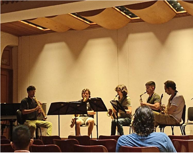
Ilustración 14 Con Fuocco Sax

Con Fuocco Sax, fundada en el año 2021 bajo la tutela del reconocido maestro Nelson Mauricio Navarro, emerge como una vibrante expresión musical en el paisaje artístico de Ibagué, Colombia. Compuesta por talentosos estudiantes del Conservatorio del Tolima, esta agrupación encarna la pasión y el compromiso por la excelencia musical.