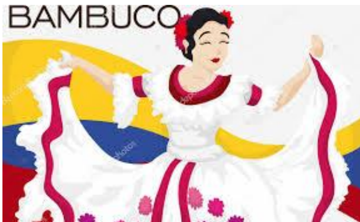
Ilustración 3 Bailarina