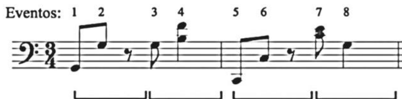
Ilustración 10 Variación del pasillo