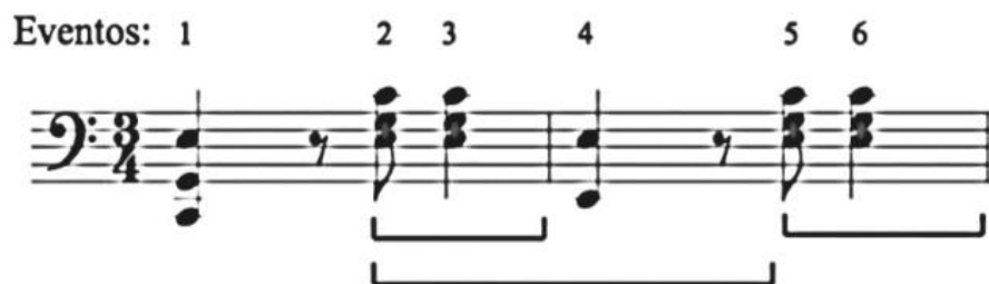
Ilustración 11 Variación dos del pasillo