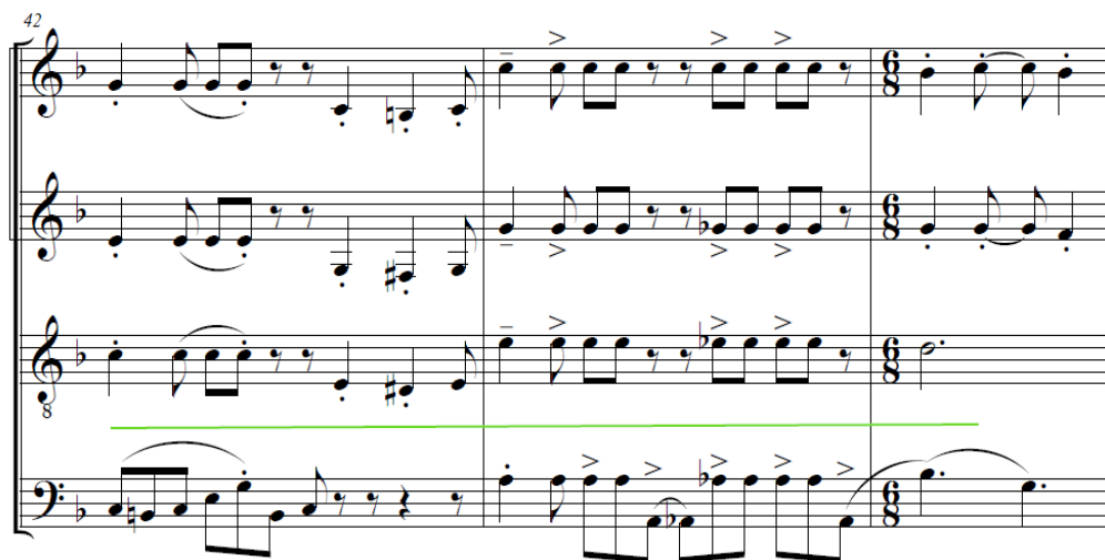
Ilustración 29 Análisis sección C Bambusax.