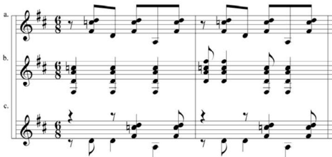
Ilustración 5 Patrón Rítmico del bambuco en la guitarra

versatilidad le permite participar en una variedad de géneros musicales, (Regiones Colombianas, 2023).