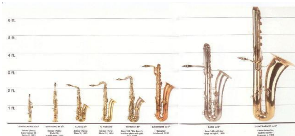
Ilustración 23 Familia de saxofones