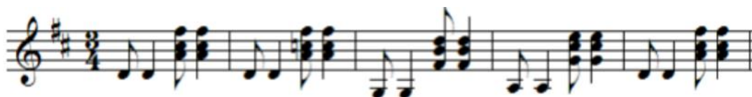
Ilustración 9 Patrón rítmico del pasillo

A continuación, se muestra el patrón rítmico del pasillo con algunas de sus variaciones. Como se observa en las imágenes, en el acompañamiento de piano, la mano izquierda toca una corchea y una negra en compás de 3/4, seguida de una corchea y una negra en la mano derecha.