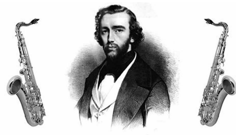
Ilustración 21 Adolphe Sax