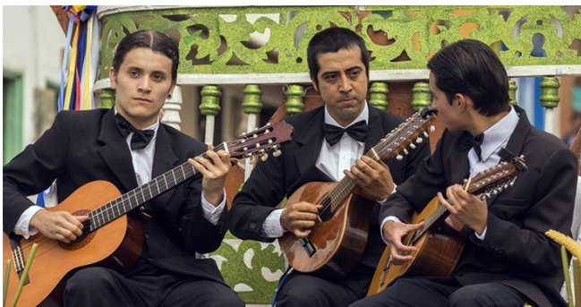
Ilustración 8 Trío de cuerdas