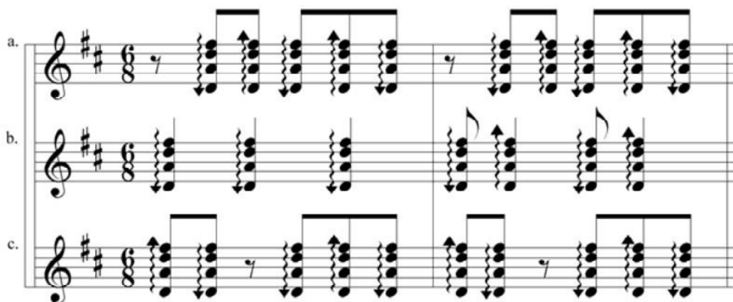
Ilustración 4 Patrón rítmico del bambuco en el tiple

El tiple, es un instrumento de cuerda colombiano similar a la guitarra española, es común en la región andina y los llanos orientales Núñez (2023). Se usa en estudiantinas, duetos y conjuntos de rajaleña. Se toca rasgueando las cuerdas para crear ritmos y formando acordes con la otra mano. Según Gonzales (2007) puede ser interpretado de dos maneras una melódica, utilizando un plectro o pulsación digital, y otra más habitual, donde se emplea en el acompañamiento instrumental, realizando rasgueos para funciones armónicas. El tiple acompaña melodías de flauta o requinto y armoniza los bajos de la guitarra, además de proporcionar ritmo a los instrumentos de percusión