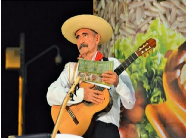
Ilustración 1 Guitarrista en festival de bambuco