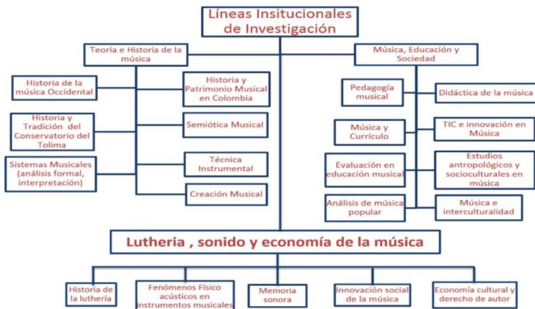
Tabla 4 Líneas de investigación