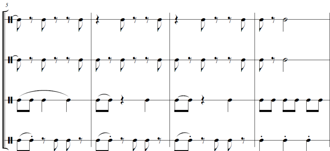
Ilustración 41 Análisis rítmico reexposición El Calavera